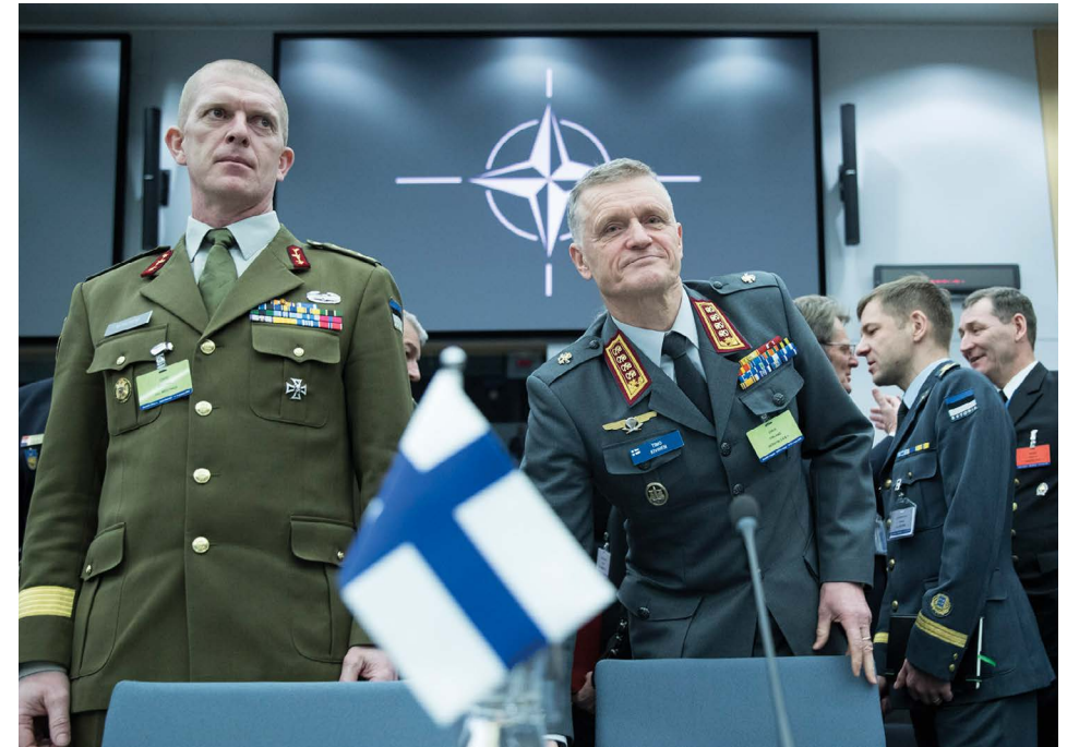
Viron puolustusvoimain komentaja Martin Herem ja Suomen puolustusvoimain komentaja Timo Kivinen.

Vaikka tiedämme ettei Natolla ole tarkoitusta ja eikä edes sitä halutessaan kykyä sodan aloittamiseen Venäjää vastaan ei voi sivuuttaa sitä, että iso osa venäläisistä todella uskoo tällaiseen mahdollisuuteen. Vaikka valtion johdossa tällaista pelkoa toki lietsotaan kyynisesti ja vastoin parempaa tietoa oman voimapolitiikan oikeuttamiseksi, on historia kuitenkin sen opettanut, ettei venäläisten aitoa paranoiaa pidä aliarvioida, vaikka se ei tosiasioihin perustuisikaan.