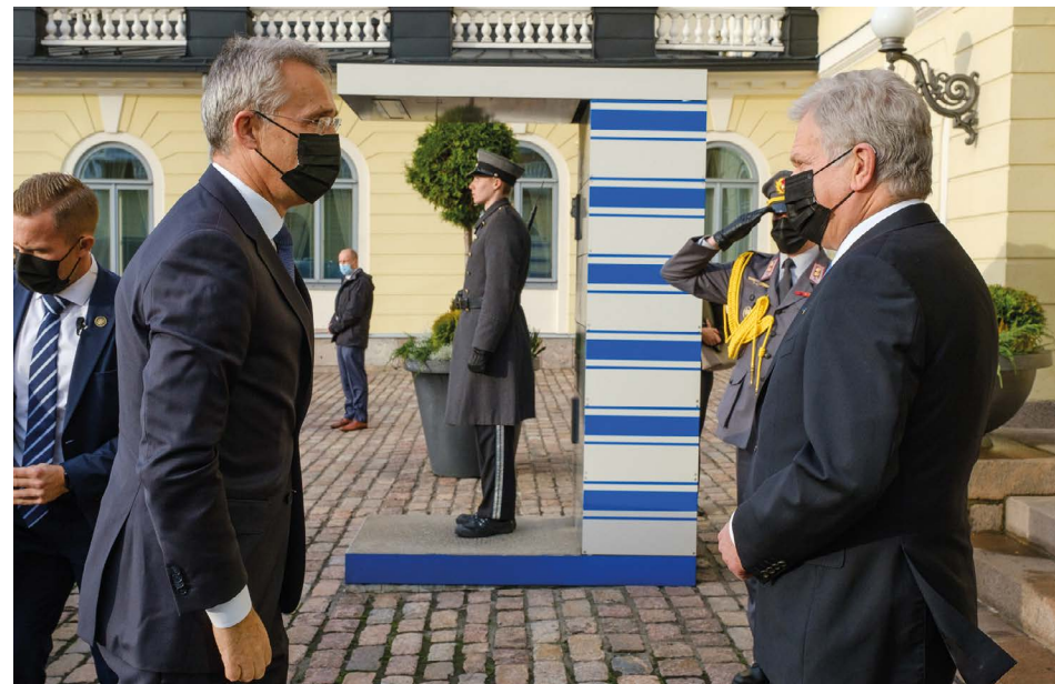
Naton pääsihteeri Jens Stoltenberg ja Suomen presidentti Sauli Niinistö tapasivat Suomessa.

”Se mitä mielipidemittaukset eivät tuo esiin on intensiivisyys, jolla jäsenyyttä kannatetaan tai vastustetaan.”