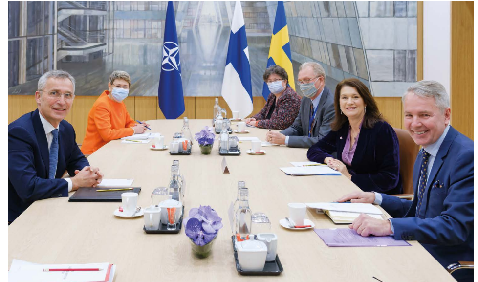
Naton pääsihteeri Jens Stoltenberg tapasi Suomen ulkoministerin Pekka Haaviston ja Ruotsin ulkoministerin Ann Linden tammikuussa 2022.

Varautumissuunnitelmissa ei muutoinkaan lähdetä siitä, että kukaan tarkoituksellisesti haluaisi aloittaa täysmittaisen maailmansodan suurvaltojen ja niiden liittolaisten välillä. Kriisit alkavat jostain alueellisesta voimankäytöstä, joka voi kuitenkin, jälleen ilman nimenomaista tarkoitusta, laajentua yhä täysmittaisemmaksi sodankäynniksi koko ajan avautuvilla uusilla rintamilla.