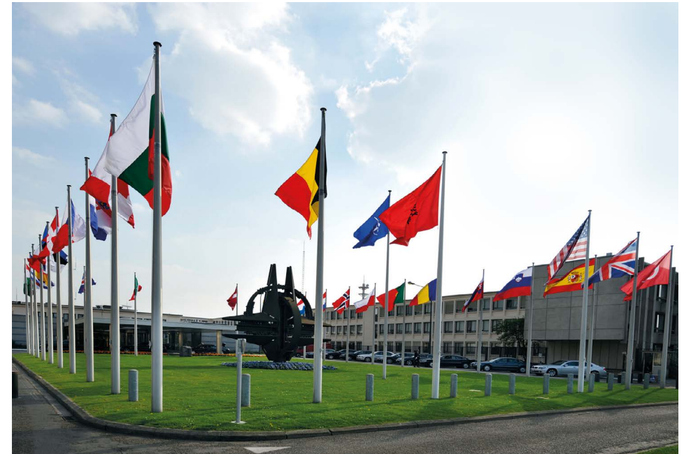
Naton päämaja Brysselissä, Belgiassa.

Ydinasekieltosopimuksen voimaantulo ei ilman ydinasevaltojen mukaantuloa toki vielä poista yhtään ydinasetta maailmassa. Toisin kuin Suomessakin UM:n virkamiesten taholta on yritetty esittää sopimus ei suinkaan heikennä vaan tukee ydinsulkusopimuksen vahvistamista, kuten eduskunnan ulkoasiainvaliokunta jo viime vaalikaudella yksimielisesti totesi. Sopimuksen voimaantulo myös lisää ydinasevaltoihin kohdistuvaa painetta palata ydinaseriisuntaneuvotteluihin ja käynnissä olevan ydinvarustelukierteen katkaisemiseen.