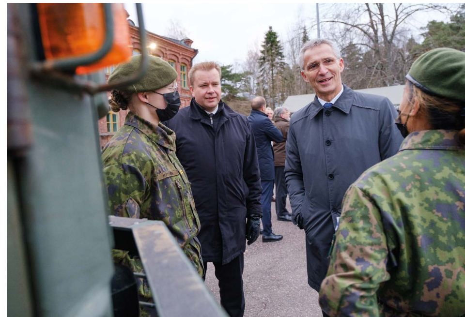
Naton pääsihteeri Jens Stoltenberg keskustelelee rajajääkärien kanssa Santahaminassa. Vieressä Suomen puolustusministeri Antti Kaikkonen.

”Selvin, kiistattomin ja ainoa varma tapa varmistaa kansan tuki sotilasliiton jäsenyydelle on kansanäänestys.”