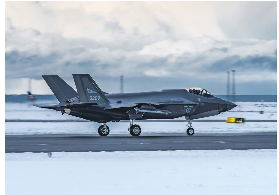
Kuvassa Norjan ilmavoimien käyttämä F-35. Sama hävittäjämalli päätettiin hankkia myös Suomeen.

Emme siten Nato-kumppanuudella tähtää Naton jäsenyyteen tulevaisuudessa emmekä hae paikkaa sen operaatiosuunnitelmissa. Se mitä haemme, on ennen muuta sellaista tietoa ja harjoittelun kautta saatavaa kokemusta, mikä tehokaimmin palvelee oman kansallisen puolustuksemme osaamisen ja uskottavuuden parantamista, samoin kuin yhteistoimintakyvyn kehittämistä sellaisia