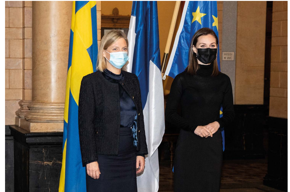
Suomen pääministeri Sanna Marin tapasi Ruotsin pääministeri Magdalena Andersson Helsingissä joulukuussa 2021.

Tätä Lissabonin sopimuksen artiklaa ei lisäyksestä riippumatta voi kuitenkin pitää samanlaisena ja yhtä pitkälle menevänä veloitteena kuin Naton 5. artik-